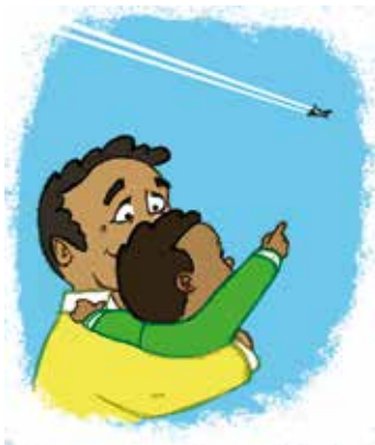
... ምርድዳኽ ናይ ኢድ ምንቅስቃስ ተጠቐምካ