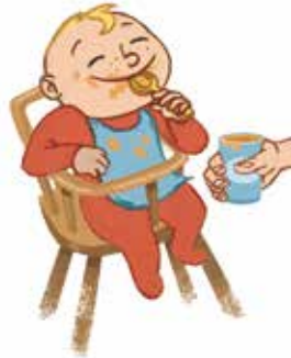
... ምድህሳስ ነገራትን ናጻ ንምኳንን