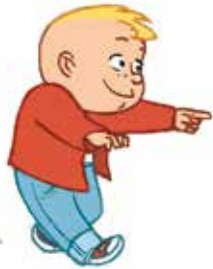
... ምድህሳስ ዝሰፍኡ ዘሎ ከባቢታተይ