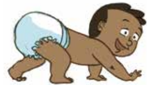
... ምምሃር ከመይ ኢልካ ከምተንፍፋሎኻ፡ ደው ትብልን ብኸግሪ ትሸይድን